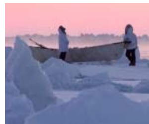
Ishavet nord for Alaska, 1999, -60°

Channel 6 Television har mange års erfaring i produktionslogistik – hvorved et hold og udstyr kan placeres - og supporteres hvor som helst i verden.