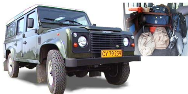
EFP 1 – Klar til optagelse!

Foruden Digibeta råder vi over to Betacam SP EFP enheder – alle sammen komplet med Vinten support udstyr, SQN lydmiksere, ARRI belysning og meget mere. Desuden kan vores EFP produktioner trække på husets store maskinpark – herunder dolly og kamerapiestaler, en 5m kamerakran, samt et omfattende sortiment af lysudstyr.