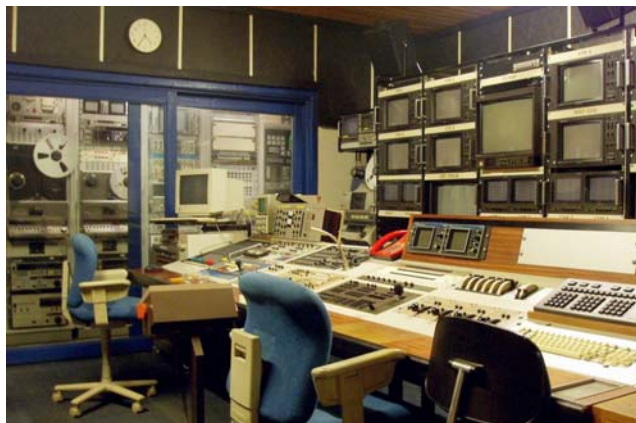
Edit 1 – analogredigering og kontrolrum til studiet

I vores 130 kvm studie har vi produceret mange musikprogrammer, børneudsendelser og reklamespots. Studiet har kapacitet til 6 kameraer og er udstyret med lysloft og er forbundet med kontrolrummene til lyd- og videoproduktion. Et stort værksted ved siden af kan håndtere de mest ambitiøse scenografiske konstruktionsopgaver.