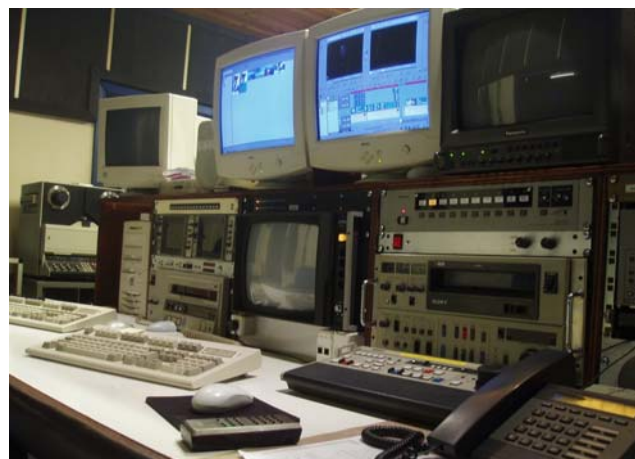
Edit 1 – DV og MPEG redigering og grafisk arbejdsstation

Edit 1 har også non-linear DV og MPEG redigering som bruges i forbindelse med authoring af video-cd og DVD produktioner.