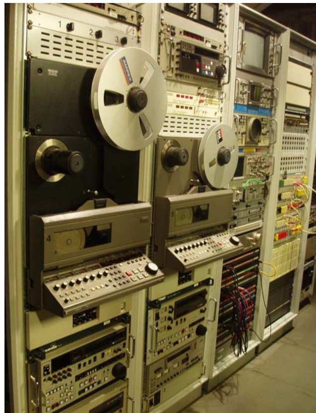
Det centrale maskinrum

Studiets centrale maskinrum omfatter flere analog båndformater og har såvel digitale som analoge forbindelseslinier til husets øvrige tekniske områder.