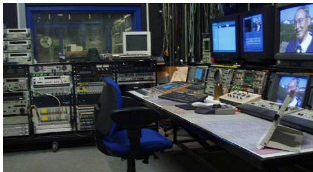
Edit 2 – digital redigeringsrum

Alle nye produktioner i dag redigeres i Edit 2 – virksomhedens digitale redigeringsrum. Lyd og billeder, grafik og musik lagres centralt på virksomhedens medieservere, hvor der er kapacitet til flere hundrede timers optagelser. Materialet er således tilgængeligt fra digital arbejdsstationerne i begge redigeringsrum og i lydstudiet.